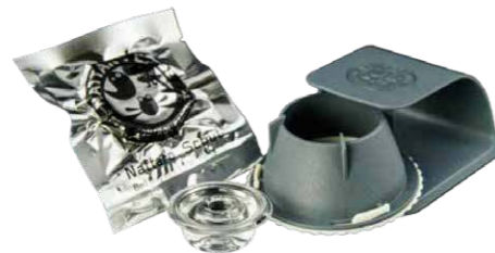
Fallenset mit Köder

Bei Verdacht auf Bettwanzenbefall oder zur weiteren Überwachung nach einer Bekämpfung empfehlen wir die Anwendung von Nattaro® Scout . Die Falle enthält einen Lockstoff, den Bettwanzen abgeben, um sich zu versammeln. Das Pheromon zieht sowohl Männchen als auch Weibchen an. Einmal in der Falle, kommen sie nicht mehr heraus.