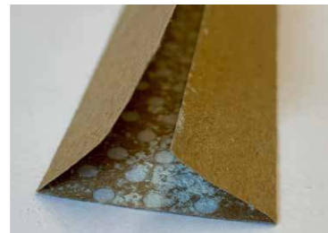
Nattaro® Safe Leiste mit Wirkstoff

Nattaro® Safe kann problemlos unter dem Bettrahmen, am Kopfteil oder hinter angebauten Schränken befestigt werden.